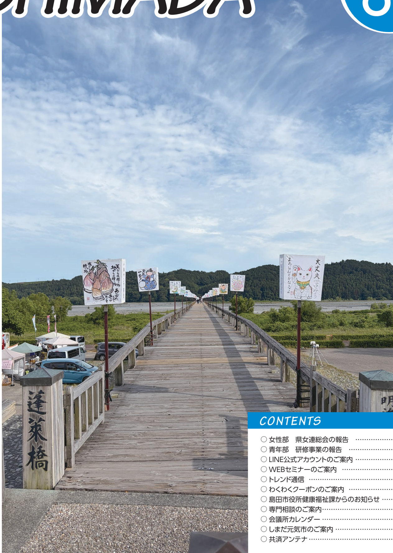
蓬萊橋ほんぼり祭り