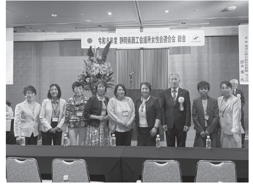
県女連総会に出席した女性部メンバー