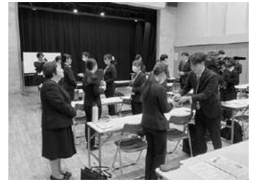
ビジネスマナーを学ぶ参加者

参加者からは、「電話対応、言葉づかいについて細かく学ぶことができた。今後の業務に活かしたい」などの感想が聞かれた。