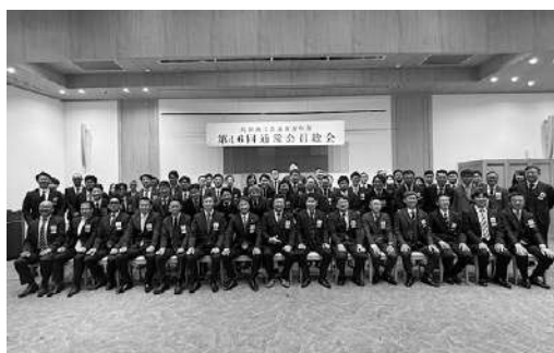
令和8年度 島田 YEG 集合写真

総会では令和7年度事業報告・収支決算及び令和8年度事業計画案・収支予算案について審議し、それぞれ原案通り承認された。