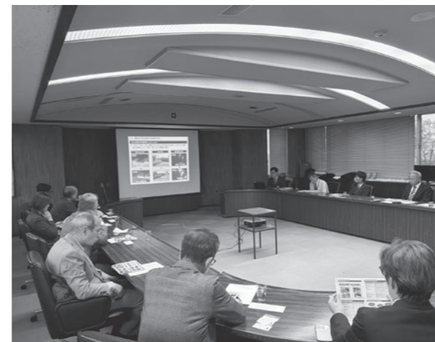
情報交換会の様子