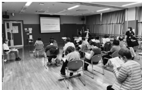
熱心に健康講話を受講する参加者

セミナー終了後昼食を取りながら、それぞれの活動内容について報告をするなど、和やかな雰囲気の中で情報交換を行った。