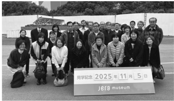
JERA碧南火力発電所での集合写真

当日は、最新の発電技術や環境負荷低減に向けた研究について詳しい説明をいただいたほか、広大な敷地に整備された設備を間近で見学し、エネルギー産業の最前線に触れる貴重な機会となった。視察後は、豪華な海鮮料理を堪能したり、買い物を楽しむなど、参加者同士の交流も深まり有意義な時間を過ごした。本研修を通じてより環境技術への理解が深まり、部会活動の活性化にもつながる有益な視察となった。