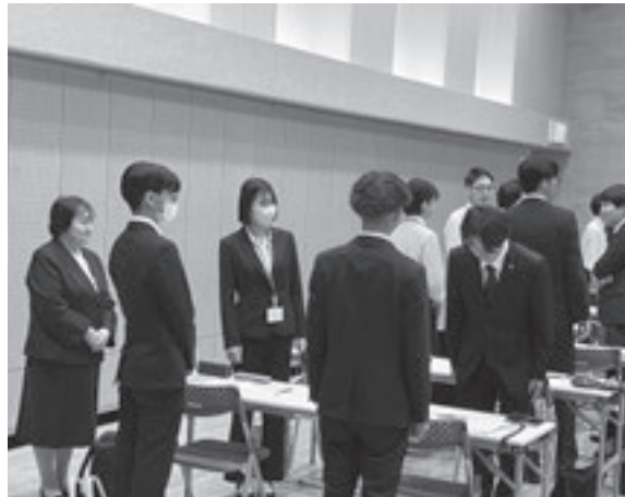
ビジネスマナーの基本を学ぶ参加者

講義後には、「学生時代のアルバイトと社会人では、意識の持ち方が全く違うと実感した」などの感想が聞かれた。