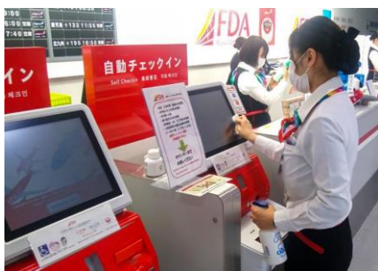
自動チェックイン機の消毒

空港ではソーシャルディスタンスの観点で、チェックインカウンターなどにおいて、可能な限りお客さま同士の距離を確保するために、距離の目安を伝える展示をしております。みなさまのご理解とご協力をお願い申し上げます。