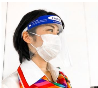
地上係員のマスク・フェイスシールド着用

ご搭乗手続きの際に、すべてのお客さまに非接触型体温計による検温と体調の確認をさせていただきます。みなさまのご理解とご協力をお願い申し上げます。