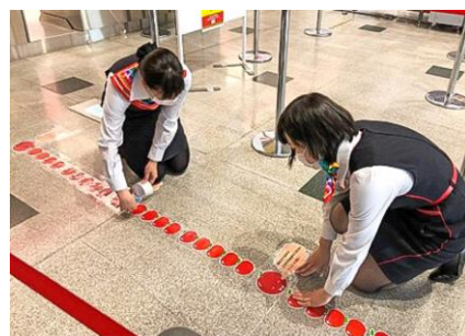
空港内でのソーシャルディスタンス