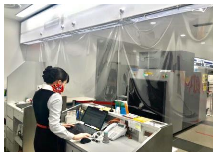
ビニールカーテンの設置