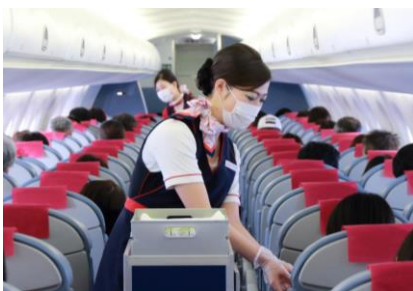
客室乗務員のマスク・手袋着用